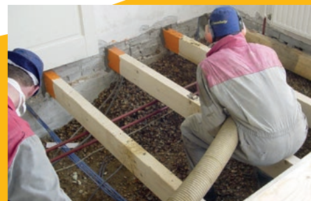
Schelpenisolatie bij renovatie