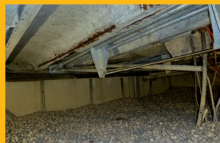
Nazorg bij aangetaste betonvloeren