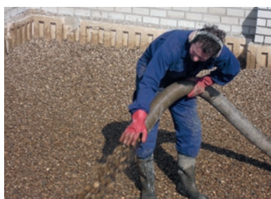
Schelpenisolatie bij nieuwbouw....