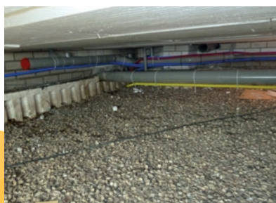
Kostenbesparend en duurzaam

Voor meer informatie over Isoschelp® gaat u naar : www.isoschelp.nl