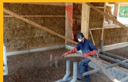
Schelpenisolatie bij natuurlijk bouwen